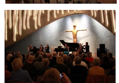
Fra konserter i Nordlyskatedralen.