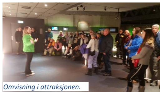
Omvisning i attraksjonen.

Det er mange forespørsler om å leie Nordlyskatedralen til konserter, møter/foredrag og omvisning, i tillegg til konserter for cruiseturister. I 2020 har det vært 13 anløp, 8 anløp ble kansellert pga pandemien. (29 anløp i 2019 og 18 anløp totalt i 2018). Det er mest vinterturisme, og de fleste båtene kommer i februar og mars. Mange av turistene deltar på lukkede omvisninger og konserter, og mange skoleklasser kommer innom for omvisning i Nordlyskatedralen og de andre kirkene, spesielt Alta kirke og Kåfjord kirke. Det er også mange turister innom på sommeren.