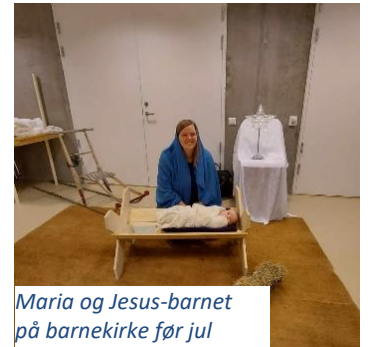
Maria og Jesus-barnet på barnekirke før jul

Vi så et behov for å markedsføre oss, og har gått rundt på City med flyers ved flere anledninger. Rett før jul gikk vi rundt med en quiz, dette førte til at vi fikk flere unge innom som aldri hadde vært på Kom.Inn! før. Vi forsto at mange ikke visste om oss, noe som vi i 2021 vil gå aktivt ut å gjøre noe med. Vi vil kontakte alle skolene i Alta med formål å komme innom klassene og fortelle om oss.