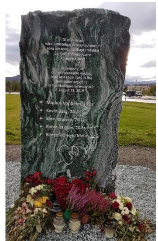
Minnesmerke etter helikopterulykka.