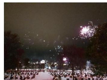
Nyttår ved Alta kirke

Mye arbeid gjøres og det arbeides med å innføre nye tiltak.