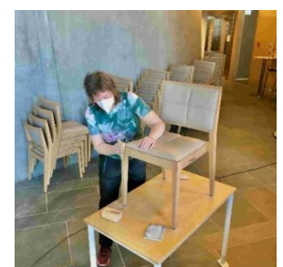
Pushing av gulvet i kirkerommet, og pushing av stoler.