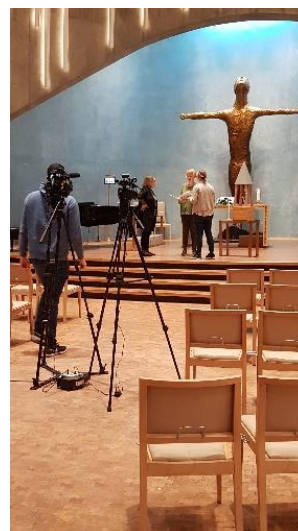
Fra opptak av sangkveld

De siste årene har det vært Bibeldagsmøtet og Hjerterom (se eget punkt) det har vært samarbeidet om.