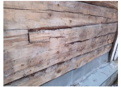
Kåfjord kirke – bak ytterveggen.

Det er utført småreparasjoner som bytte av varmtvannstank, panelovn, sandblåsing av port til gjerdet og utskifting av porthengsler. Arbeidet med vindtetting av sørveggen er godt i gang.