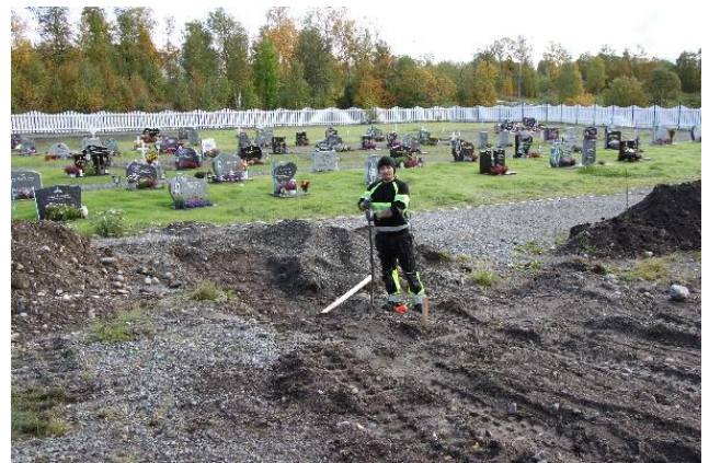
Maling av Alta kirke; vasking av Nordlyskatedralen; utbedringsarbeider ved Alta kirkegård